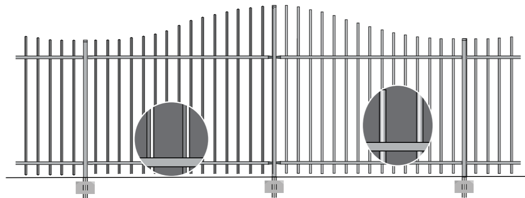
Detail spijlen (koker en rondprofiel)